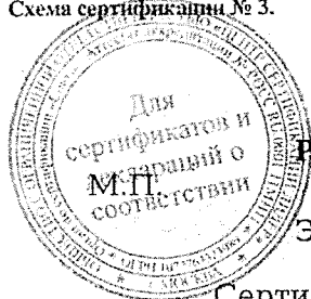
Схема сертификации № 3.